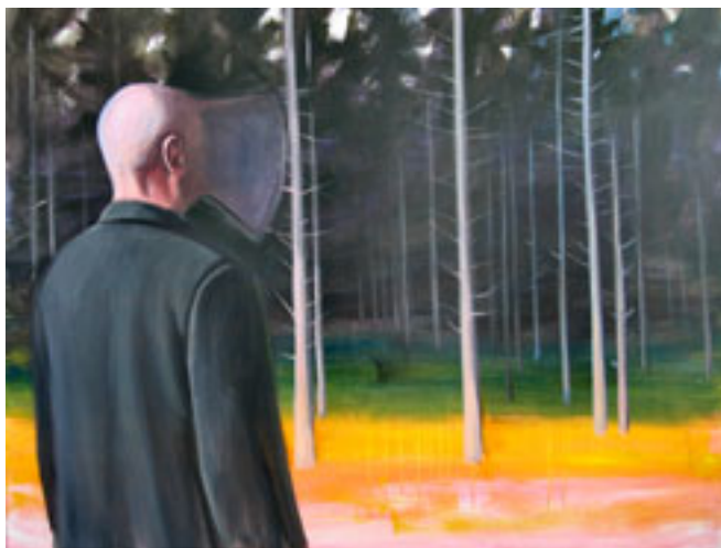
METSAS AKRÜÜL, LÕUEND, 180x140 cm, 2004, ERAKOGU