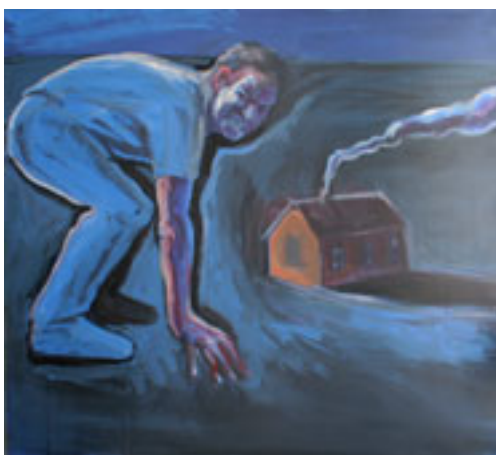
VALMISOLEK AKRÜÜL, LÕUEND, 140x110 cm, 2007, ERAKOGU