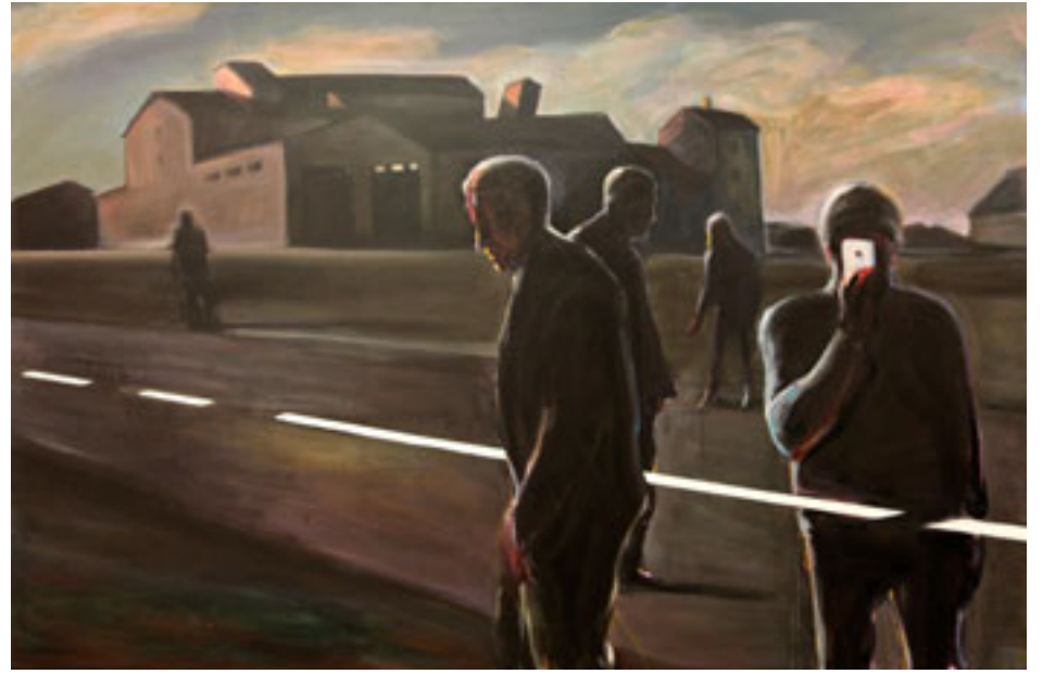
63. KILOMEETER AKRÜÜL, LÕUEND, 300x200 cm, 2011

Tsitaadid Minu Esimesele Kunstikogule pärinevad vestlusest Jaan Toomikuga 16. novembril 2011 kohvikus Vabadus.