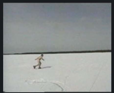
ISA JA POEG VIDEO, 1998