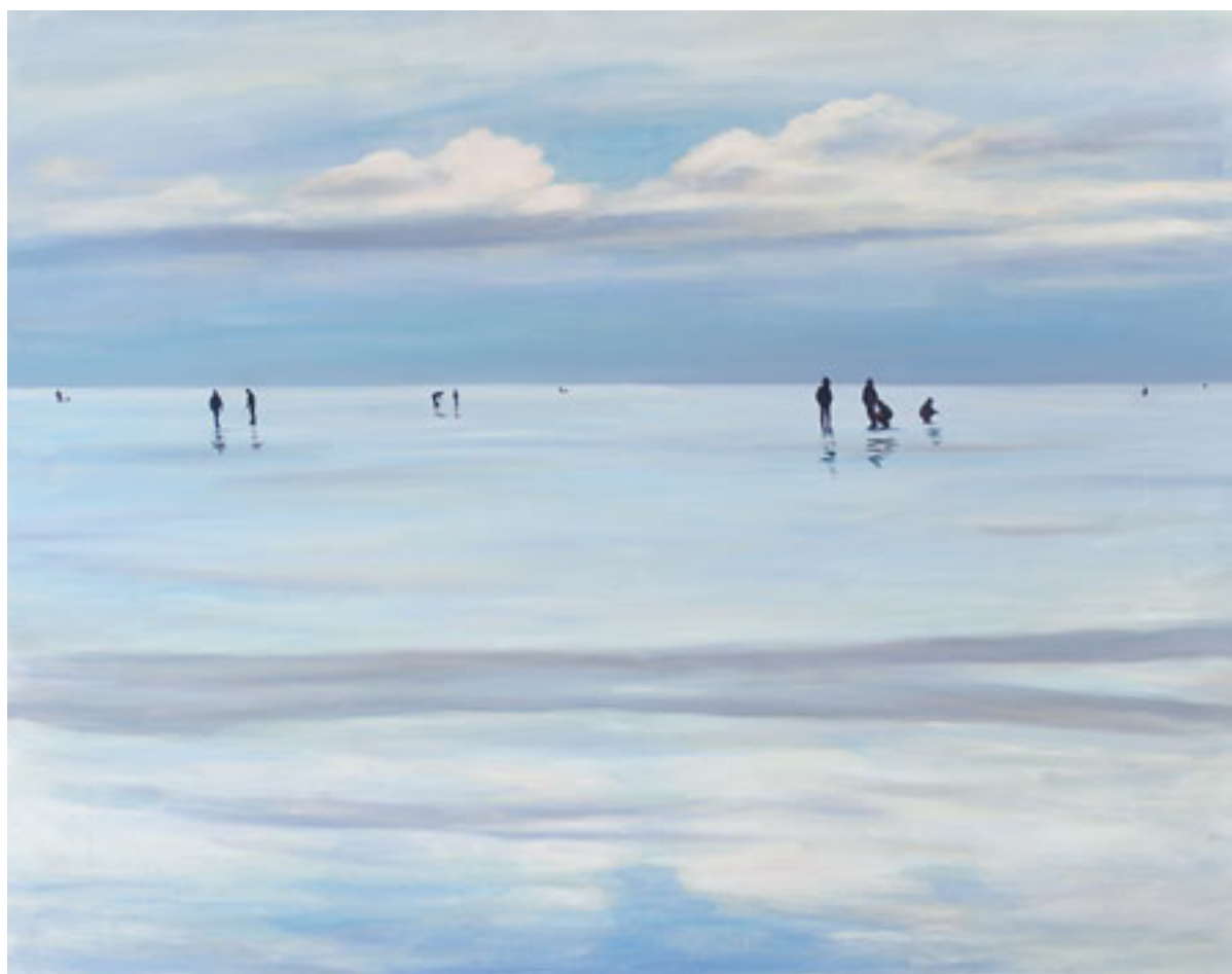
KALAMEHED AKRÜÜL, LÕUEND, 180x150 cm, 2008, ERAKOGU

Minu arvates on tänane kunst sedavõrd laia haardega ja mitmekesine, et igaüks võib leida sellest osa, mis teda kõnetab. Tänapäeva kunstist leiab piisavalt nii kontseptuaalsust kui ka puhtakujulist esteetikat, piirid puuduvad. Aga kindlasti ei ole näiteks