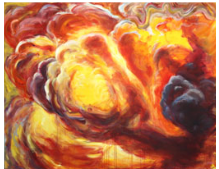
OTSE PARADIISI AKRÜÜL, LÕUEND, 250x200 cm, 2011