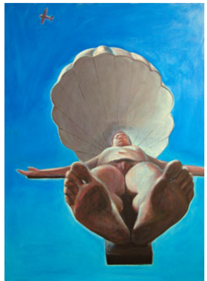
LANGEVARJUR AKRÜÜL, LÕUEND, 185x140 cm, 2004, ERAKOGU