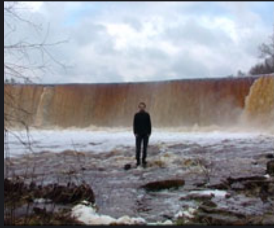
JUGA VIDEO, 2005