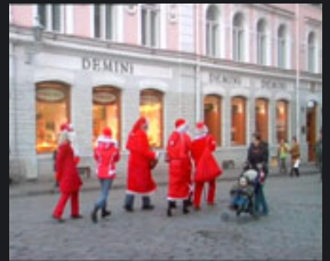
HARE CHRISTMAS VIDEO, 2007