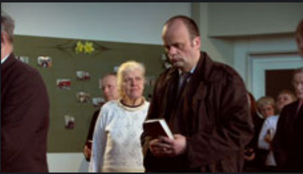
ARMULAUD LÜHIFILM, 35 mm, 2007