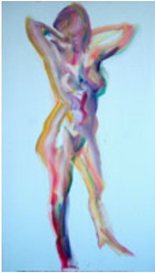
AKT AKRÜÜL, LÕUEND, 140x90 cm, 2010, ERAKOOGU