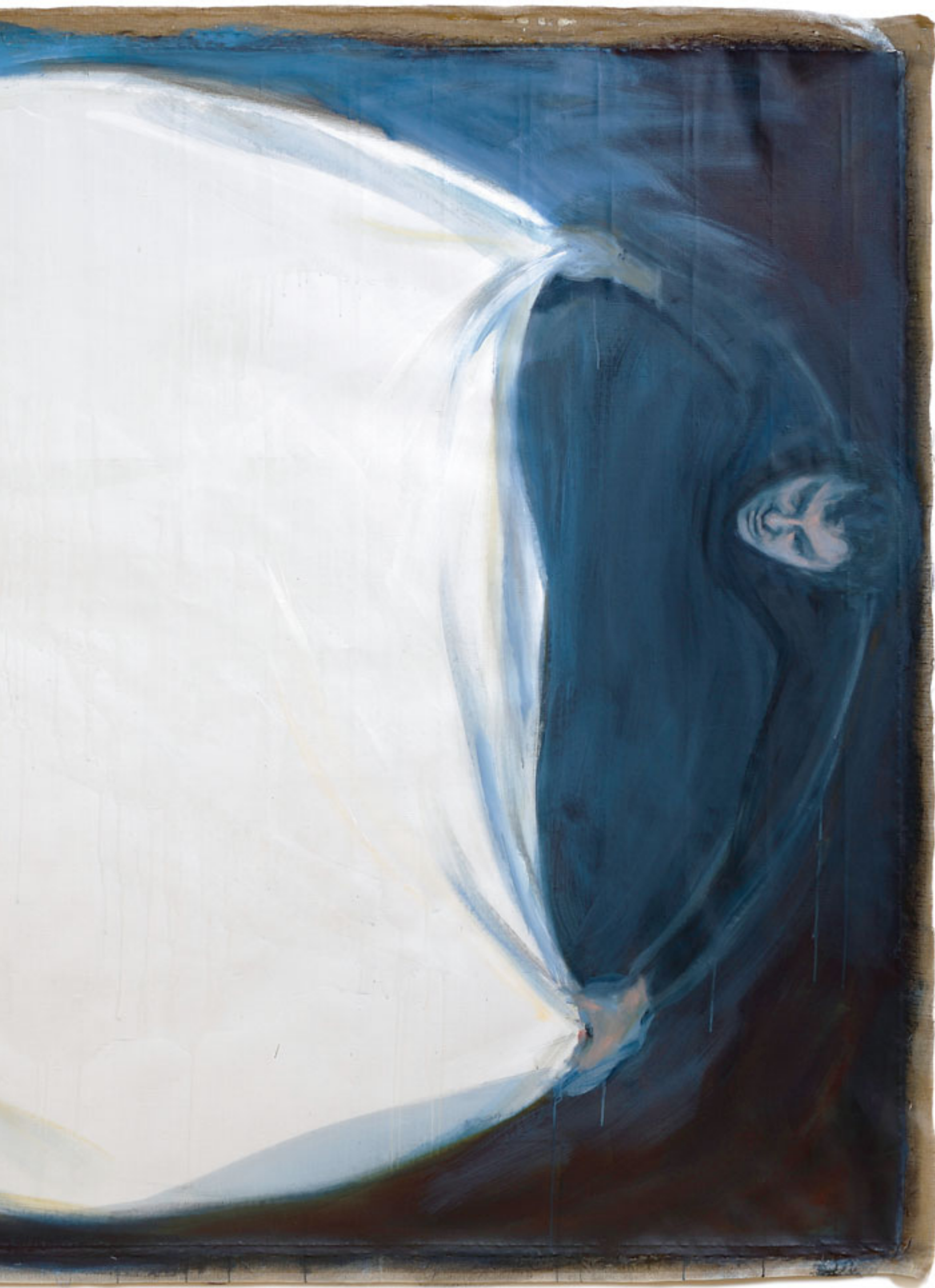
LINA AKRÜÜL, LÕUEND, 300x200 cm, 2010, EESTI VÄLISMINISTEERIUMI KOGU