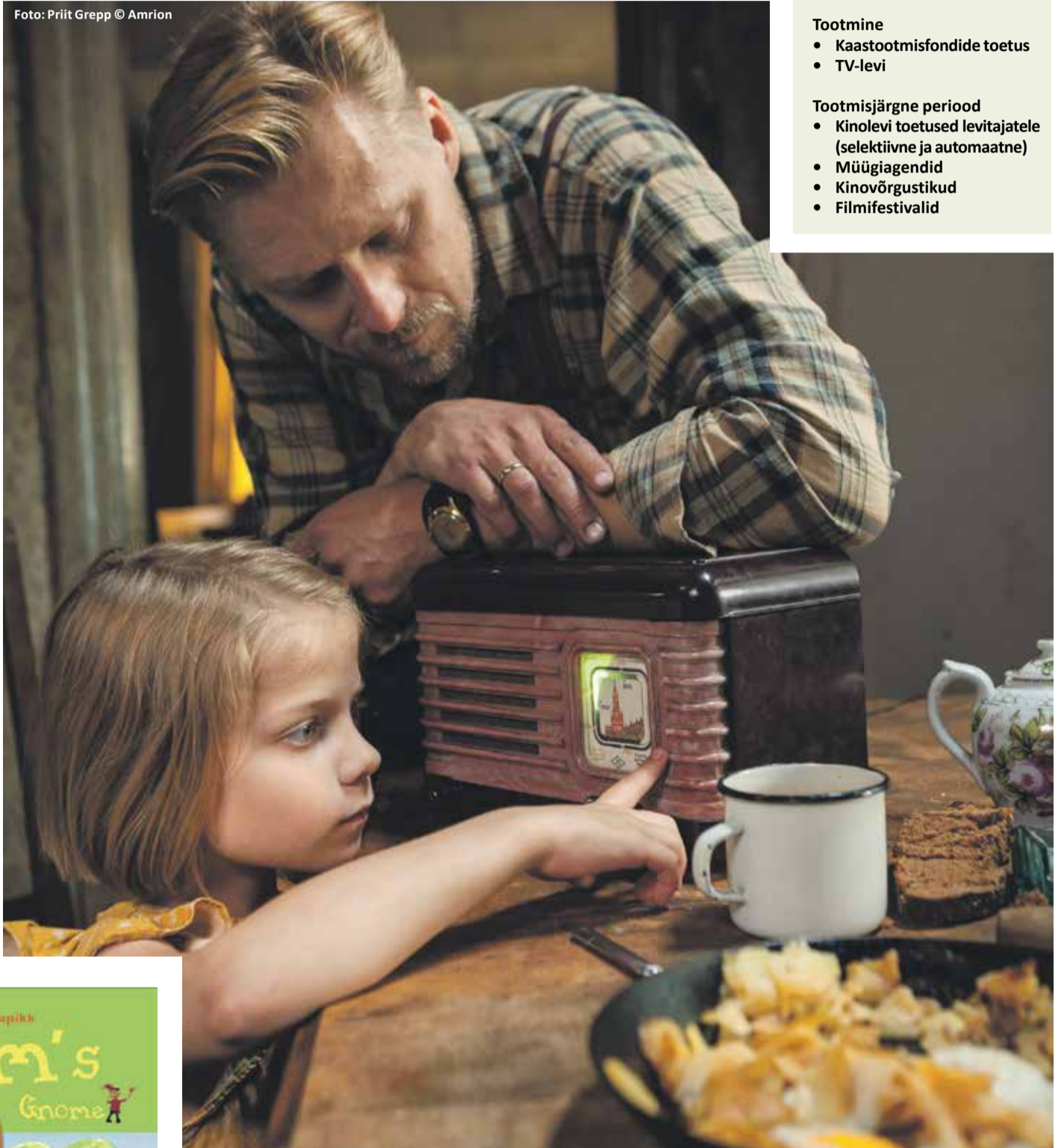
MEDIA arendustoetus eraldati Amrion OÜ filmiprojektile „Seltsimees laps“, mis esilinastub 2018. aasta kevadel.

laketrajad“, „Tuvid“, „Moest väljas“, „Jeesus elab Siberis“, „Varessaare venelased“, „Vähemusolümpia“ jt.