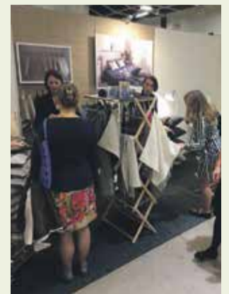
KOOSdisaini kaubamarki kandvad esemed püüdsid messil külastajate pilke.

„Saime hulganisti positiivset tagasisidet ja potentsiaalseid koostööpartnereid. Praegu tegeleme Habitarelt saadud kontaktidega ning töötame edasi,” lausub ta rõõmsa enesekindlusega.