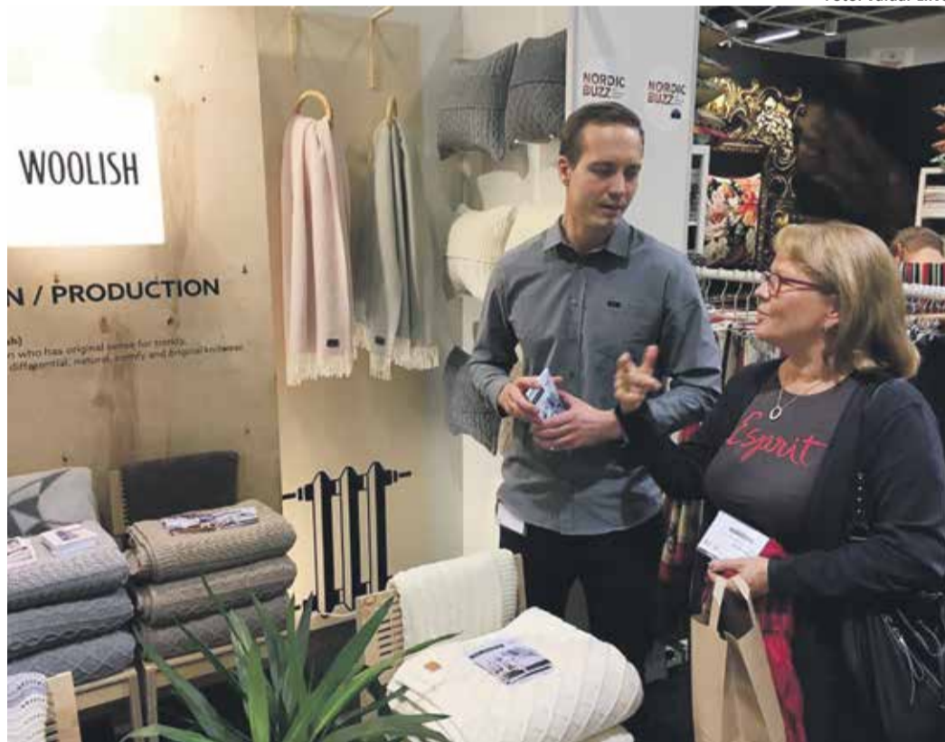
Woolish Knitting Habitarel. Nende kudumid meeldisid soomlastele väga.

Ettevalmistused algasid seega juba veebruaris. Woolish Knitting, Koosdisain, UNIKA Cardboard Trees, SIKSAK ja Tie&Apron