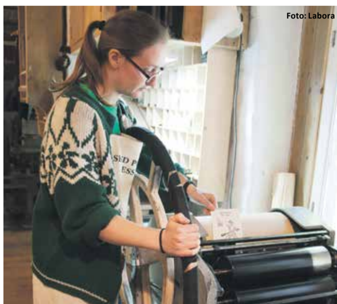
Labora soov on, et kõrgtrüki, kalligraafia ja paberivalmistamise traditsioon jätkuaks ning areneks.